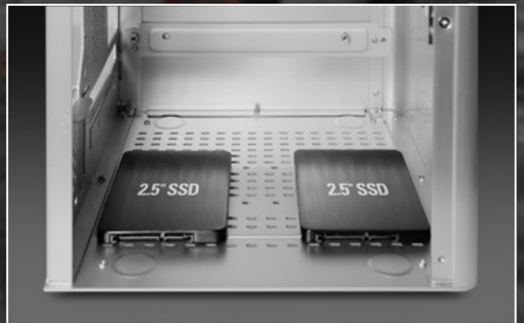
機殼底部 硬碟/SSD 不同配置安裝方式