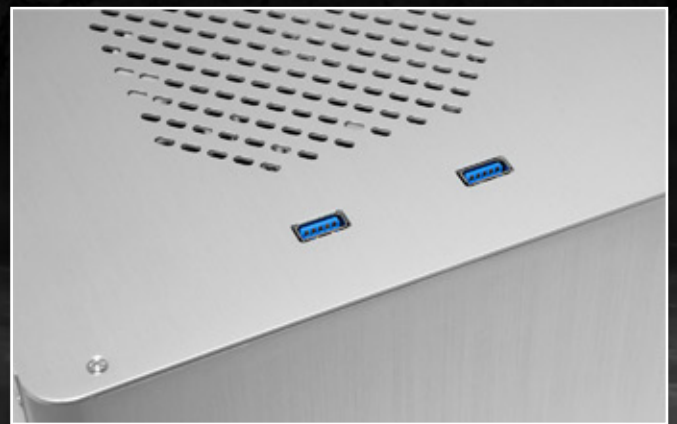
2 個 USB3.0 (19-pin 內接)