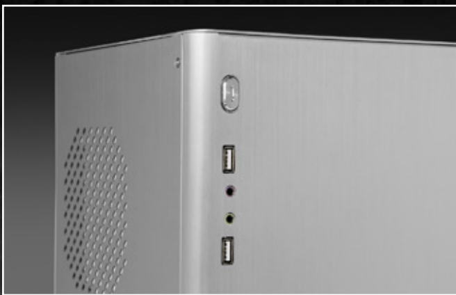
前置 I/O: 2 個 USB2.0, 2 個音頻孔