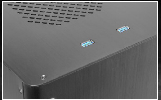
USB3.0 が 2 つ (内部 19 ピンメインボードコネクター)

PU: 1 寸法: 320 x 295 x 310 mm (L x W x H) 関税番号: 84733080 原産国: 中国