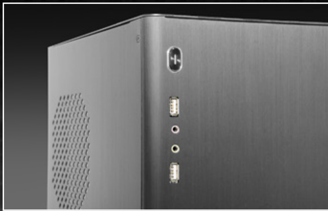
前面 I/O: USB2.0 が 2 つと オーディオポートが 2 つ